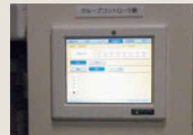
空調コントロールパネル