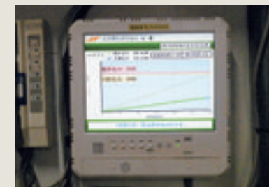
デマンドモニター