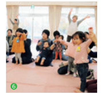
①②白鳥と雪吊りをモチーフにしたデザインのサンセットブリッジ。日中の姿も見ごたえがあるが、おすすめは夕方以降 ③5月に開催される世界の凧の祭典では内灘海岸を舞台に世界の凧が一堂に見ることができる。④内灘町総合公園にある大型遊具のテーマは「海賊船」。体をたくさん動かして遊べます。⑤木のぬくもりのある内装の白帆台小学校 ⑥親子の遊びや活動の場として利用されるカンガールーム内灘

場、子どもたちに大人気の船型の大型遊具などがあり、スポーツを楽しむ人や、家族連れでにぎわっています。敷地内にある公営の宿泊施設「内灘町サイクリングターミナル」は、バーベキュー施設や天然温泉もあり、リーズナブルな価格で宿泊できます。