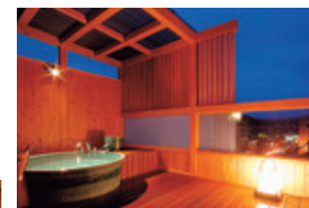
▲源泉100%の客室露天風呂